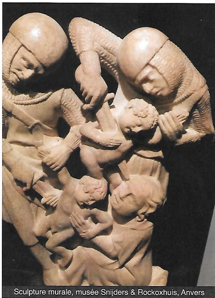
Sculpture murale, musée Snijders & Rockoxhuis, Anvers

André Breton s'était adressé à Radovan Ivšić : « Rappelez-vous cela, rappelez-vous bien de tout ! 3 », soulignant par là l'importance des souvenirs justes, et pas juste des souvenirs. Pour ma part, j'aurais bien volontiers ajouté de tous, tant la multitude de morts, célèbres et inconnus, me hante et me fortifie. Comment demeurer à la hauteur de ces engagements ? C'est un héritage qui se mérite ! Annie Le Brun, lorsqu'elle évoque justement son compagnon (R. Ivšić), parle d'apparition au milieu d'une forêt où se mêlent le réel et l'imaginaire. Des paroles de feu, qui brillent dans notre vie nocturne comme des lueurs spectaculaires, annonciatrices d'une alliance du présent et des temps à venir. Sans que ces réminiscences ne nous bercent d'illusions, avançons donc !